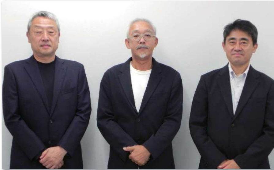
＜インタビューにお応えいただいたウエルシアオアシス㈱の皆さま＞