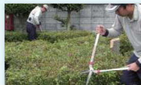
植栽チームの作業風景

度を持っています。10年近く従事しているスタッフもいて、その頼もしい仕事ぶりが各店舗の皆さまから感謝されています。ぜひ一度店舗に来てみてください。