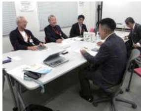
この日の取材はウエルシアオアシスの本社（埼玉県さいたま市）で行われました。皆さま、有難うございました。