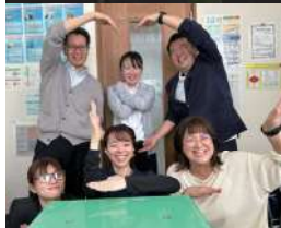
個性豊かなスタッフ はチームワーク抜群。