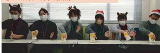
スタッフの皆さんのクリスマス会での出し物。 懸命の練習の成果を披露。