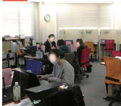
陽の光がふんだんにそそぐ暖かな事業所。この日も利用者さんたちが楽し気に訓練に励んでいた。