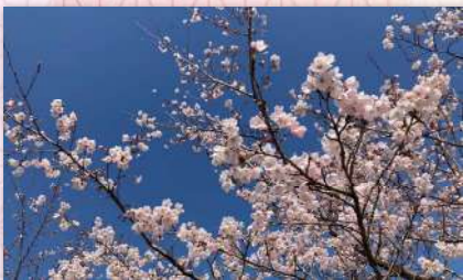
ご自愛さん (アフレッシュいわき)