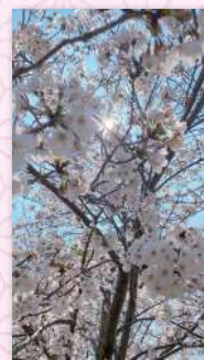
といしさん(フィン香椎駅前)