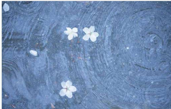
作品タイトル『みずたまりにも春』