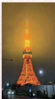
ねむいさん(フォーム竹ノ塚)

水面の波紋がとても不思議な模様を描いています。水の色と相まって、古代の土器のようにも見える、神秘的な作品です。桜との相性も◎。