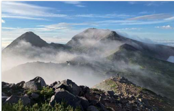
作品タイトル『白山頂上にて』